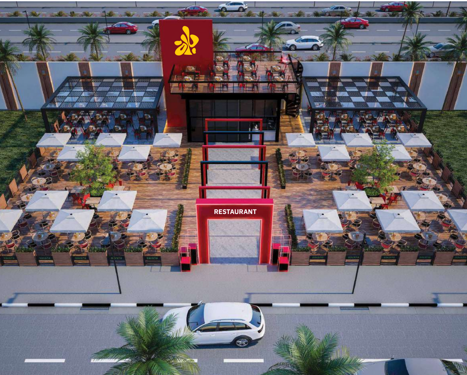
تصور مبدئي لتصميم المساحات المستقلة المخصصة للبراندات الكبرى

* مع إمكانية تنفيذ التصميمات حسب طلب العميل